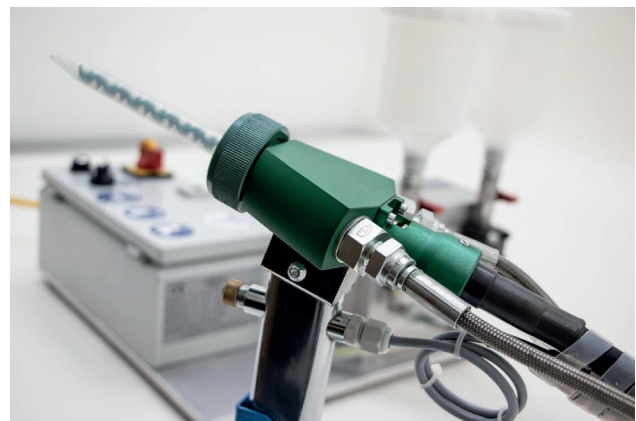
Dynamische Vermischung mit rotierendem Kunststoff-Einwegmischer.

für die dynamische Verarbeitung von 2K-Kunststoffen mit fast allen marktüblichen Dispensern anbietet. Er ist eine hochinteressante Lösung für alle jene Kleinmengen-Anwender, die Gießharze und Klebstoffe für Reparaturen, Nacharbeiten oder die Oberflächen-Optimierung mit pneumatischen Kartuschenpistolen auftragen. Denn mit dem LC-DCM können sie die Qualitätsvorteile der dynamischen 2K-Kunstharz-Mischtechnik aus der automatisierten Serienproduktion für die manuelle Applikation nutzen.