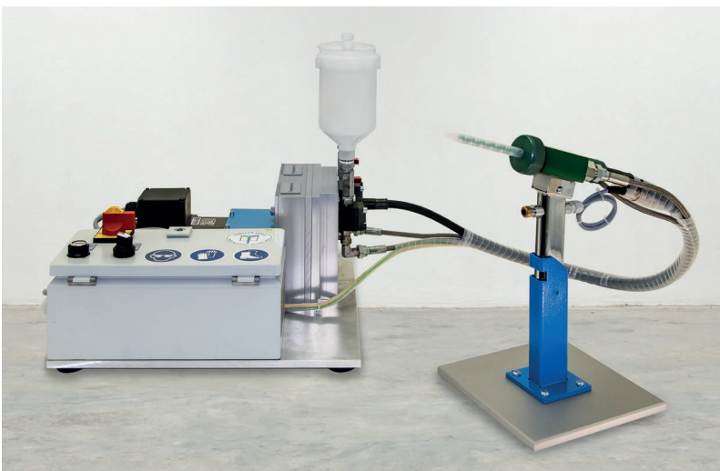
Kompakte Lösung für Kleinmengen-Dosierung: Mit der neu aufgelegten MDM 4 aus der bewährten MDM-Baureihe zeigt TARTLER auf der Fakuma ein vielseitig einsetzbares Tischgerät, mit der sich flüssige und niederviskose Medien präzise und effizient dosieren und mischen lassen.

Das Engineering von TARTLER hat die neue MDM 4 so ausgelegt, dass durch die Kombination der Pumpen Ausstoßmengen von 0,05 bis 1,5 l/min individuell konfigurierbar sind. Als Auswahlkriterien gelten hier neben dem konkreten Anwendungsfall vorrangig die Viskositäten und Mischungsverhältnisse der zu verarbeitenden Komponenten. Es lassen sich Dosierverhältnisse von 100:10 bis